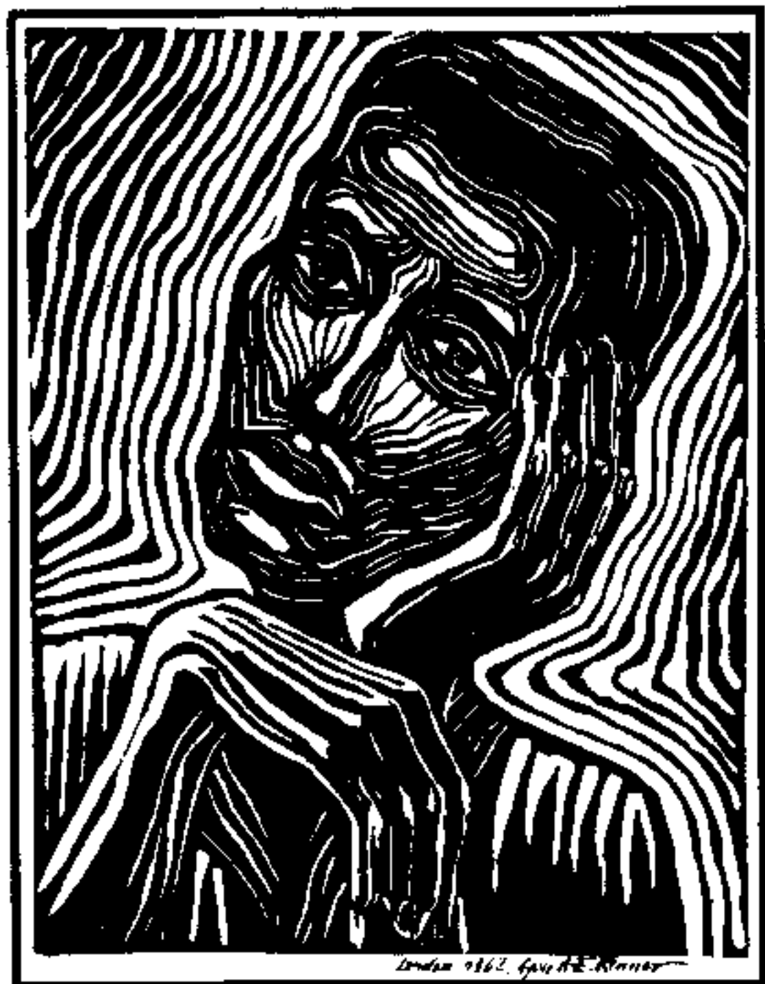
Expressionistisches Selbstportrait des Autors, London 1962; - eine Botschaft an den philologischen Kontrahenten aus einer anderen Welt