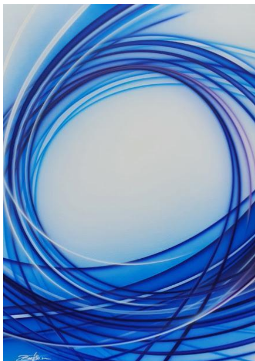
70/50" « Full dynamik in the deep »