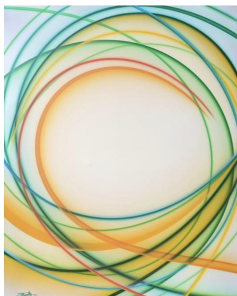
73/60" « Light up your soul »

http://cultureetplus.over-blog.com/2021/05/bormes-les-mimosas-florent-boisard.html